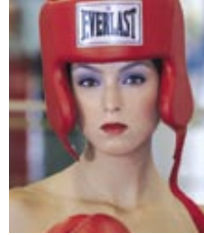
Februar: Majian www.majianeytan.ch