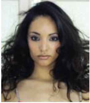
Oktober bis Dezember 2005: Racha www.racha.ch